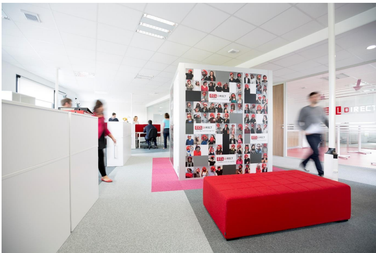
Les locaux d'ECL Direct à Saint Herblain, en périphérie de Nantes