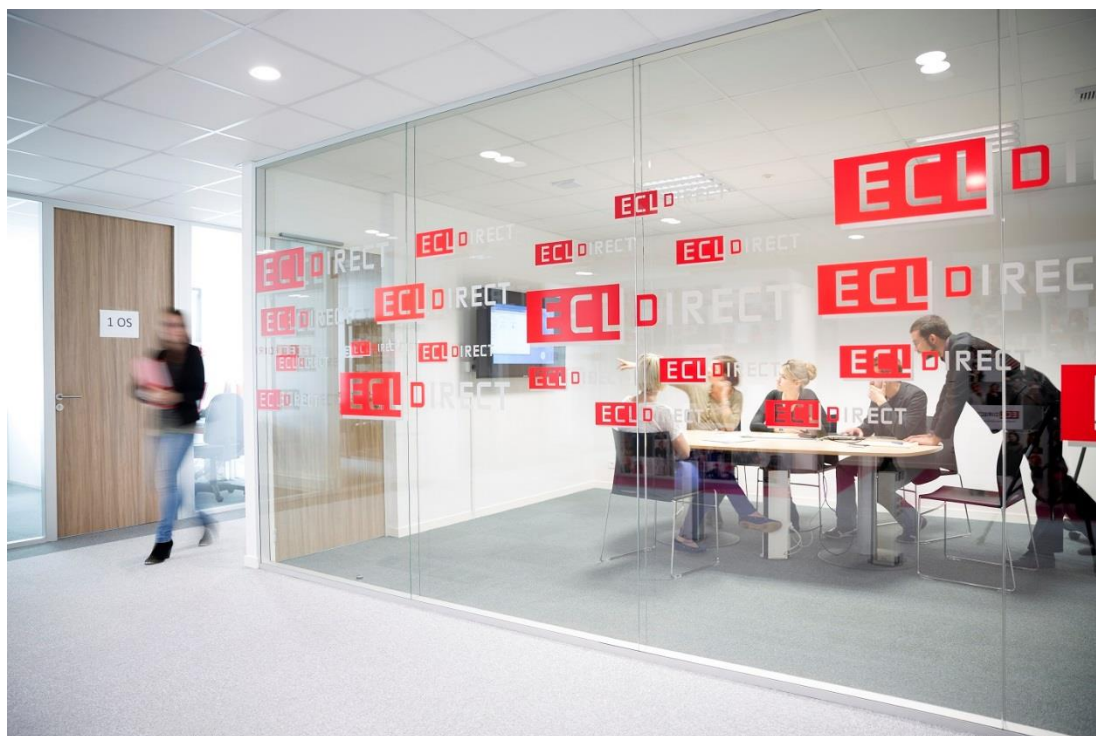
Les locaux d'ECL Direct à Saint Herblain. en périphérie de Nantes

Si ECL Direct n'est plus aujourd'hui le seul sur le marché de l'expertise-comptable en ligne, il conserve sa position de leader. Toujours en marche, l'entreprise tient à tenir le rythme soutenu de ses innovations pour garder sa longueur d'avance.