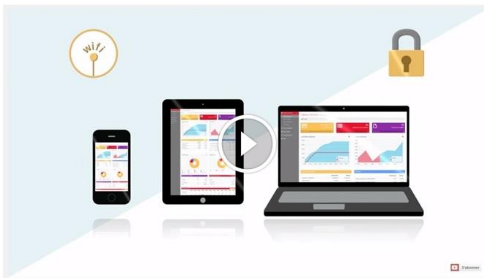
Vidéo de démonstration Fizen Expert

Fizen Expert est une solution proposée en mode SaaS. L'utilisateur n'a aucun logiciel à installer et accède à la plateforme grâce à un simple accès internet. Aucun téléchargement, aucune mise à jour, aucune sauvegarde ne sont nécessaires, tout est géré directement sur la plateforme d'ECL Direct.